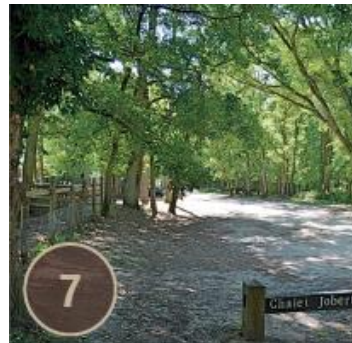
Chalet Jobert, Dame Jouanne