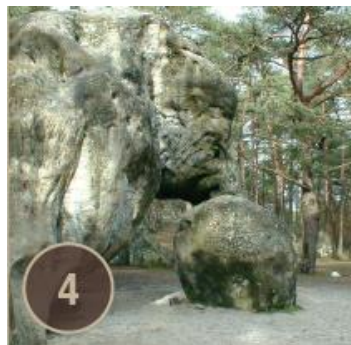
Rocher de l'Eléphant