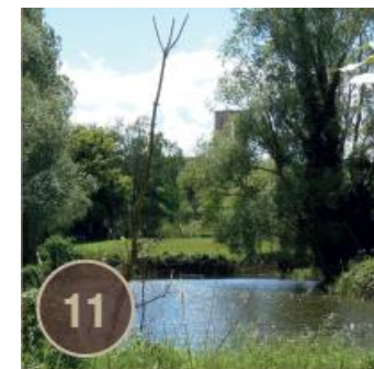
Circuit du Marais