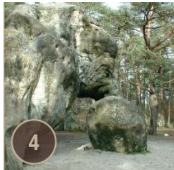
Rocher de l'Eléphant