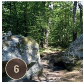
Fontaine des Petits Pots Croix Saint-Bernard