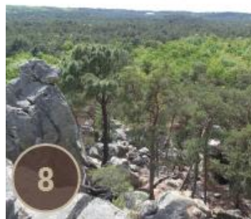
Point de vue de la Dame Jouanne